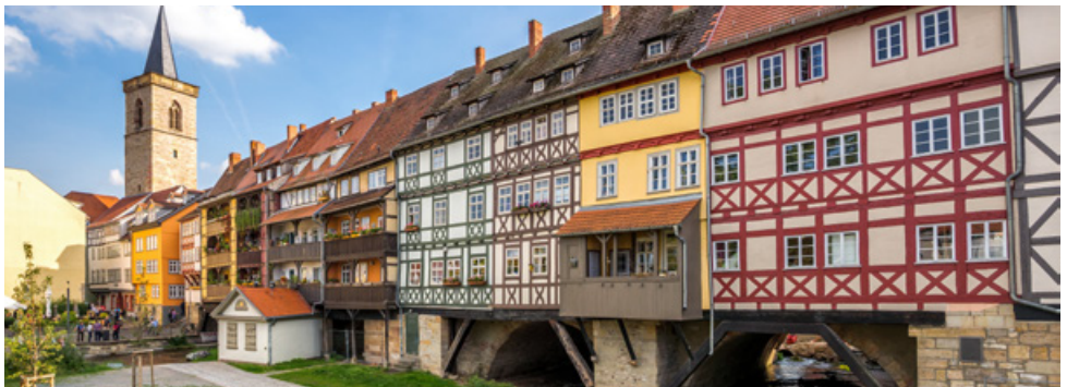
Krämerbrücke in Erfurt

Ankunft im Hotel um ca. 17:00 Uhr, gemeinsames Abendessen.