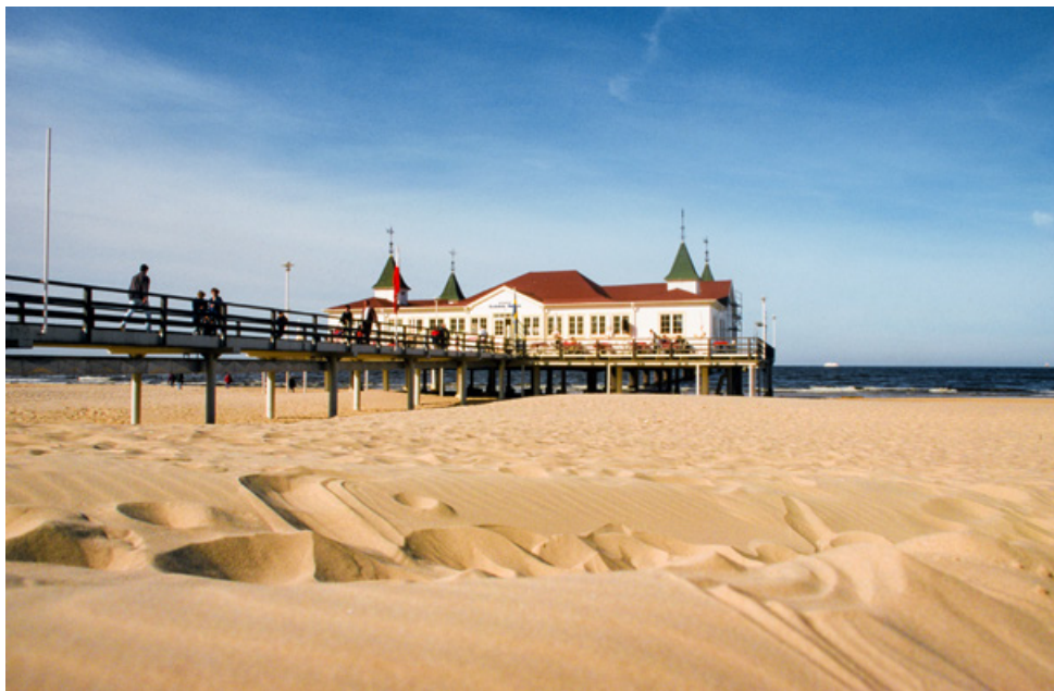
Ostseebad Ahlbeck in Usedom

Ankunft im Hotel um ca. 18:00 Uhr, gemeinsames Abendessen.